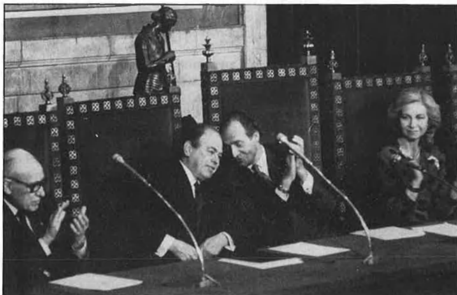
Jordi Pujol i el rei Joan Carles en la commemoració del Mil·lenari.