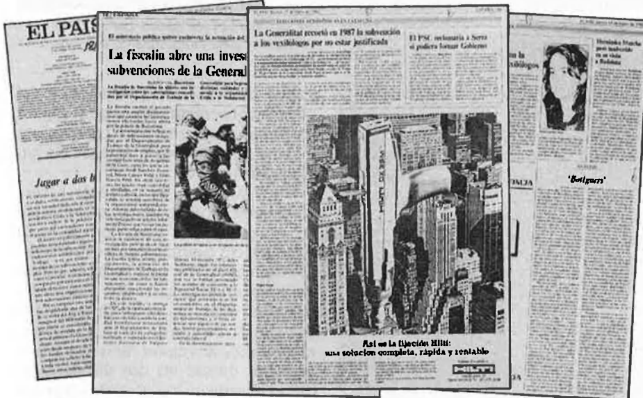
Un autèntic serial per entregues que s'ha prolongat dues setmanes.