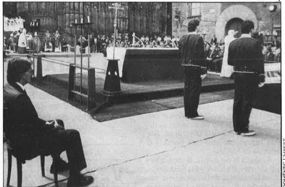
El president del govern central, Felipe González, en un moment de la missa.

—La famosa història que Tarradellas s'havia quedat amb els fons de la Generalitat i que disposava de molts milions és una pura fantasia. Quan va sortir de Catalunya, la Generalitat no tenia ni cinc de calaix, els fons havien estat lliurats al govern espanyol.