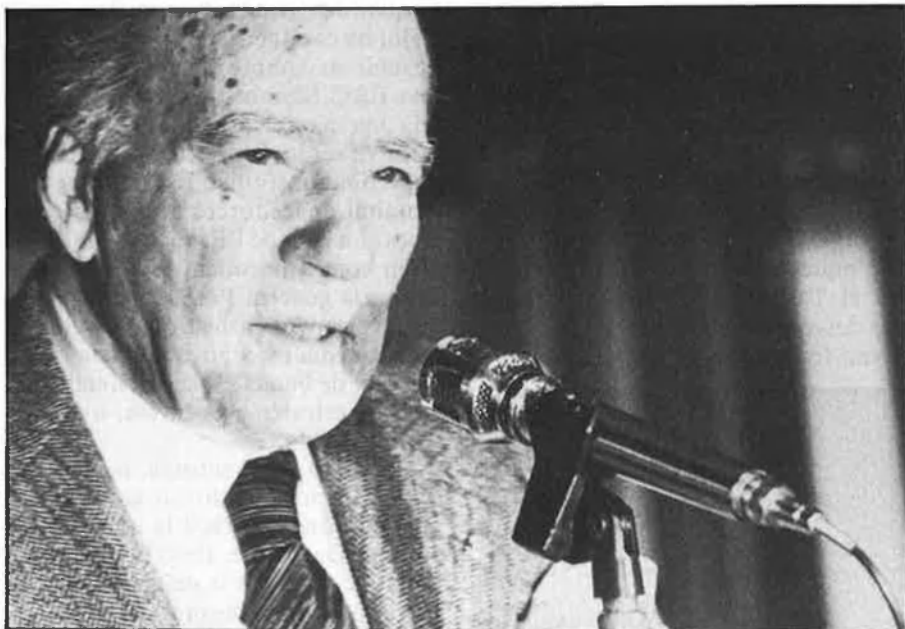
«Mai no es va amagar de dir-se republicà, i tampoc joancarlista».

També guardo la correspondència. Ens escrivíem amb adreces fictícies. I teníem un codi per a evitar els noms reals de les persones.