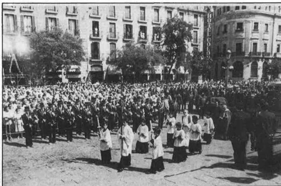
Milers de ciutadans de Catalunya reteren l'últim adéu al president mort.

Ningú no diu res, només aquell home assegut en un banc de fusta, que relata antigues batalles a un periodista derrotat, quasi indiferent. «Porto quasi vint hores de feina, i ja no em tinc dret; francament, podria haver escollit un altre dia, el president», fa amb un fil de veu. Tota la professió ha anat de bòlit el cap de setmana, al carrer o a les redaccions. Al Saló de Sant Jordi continuen desfilant, a les tres de la tarda, individus i famílies. S'acosten dues monges, i després una guàrdia urbana amb la gorra a la mà, que reté l'instint de quadrar-se i baixa el cap pensativa. No hi ha excessos: la majoria dels ulls, són secs, els comentaris són circumstancials i seriosos. Entren, acomiaden el taüt i surten cap a casa, és l'hora del dinar. Algú s'atura a tafanejar les corones, que fan tant de goig, però «¿seran flors congelades?», es pregunta una mestressa, «fan tan poqueta olor». N'hi ha d'ajuntaments, com el de l'Hospitalet, i d'entitats cíviqes, com l'Orfeó Gracienc; no hi falta el Barça, ni l'Espanyol, i les institucions han estat puntuals. «El president de la Gene-