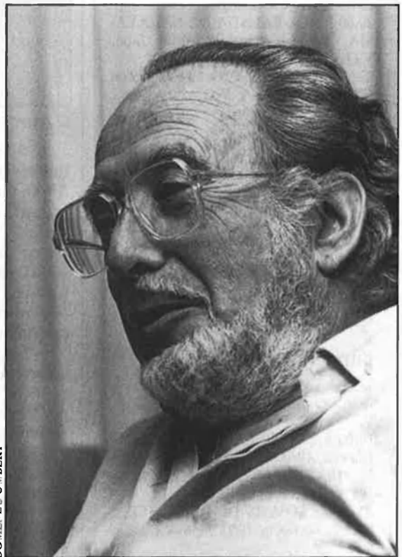
«Era un home dur, amb una visió estricta del que havia de fer».

estRICTA d'allò que havia de fer. Deia que no era de cap partit i que no volia comptar amb cap partit, sinó amb el poble en general. I ningú el feia canviar d'opinió.