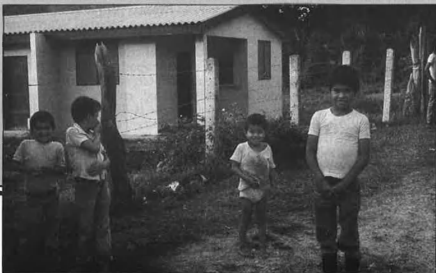
Grup de xiquets davant la «casa de salud» de San Juan de Limay, a Nicaragua.

—És una qüestió històrica. Els pobles subdesenvolupats, els pobles oprimits, cada dia admeten menys la seua situació, s'inquieten i es revelen justament. Una veritable cooperació solidària haurà de basar-se en compromisos ètics i en el questionament de les estructures socials i econòmiques que produeixen la misèria de tants pobles. És necessari contribuir a fer un món millor per a tots els homes i les dones i per a tots els pobles. □