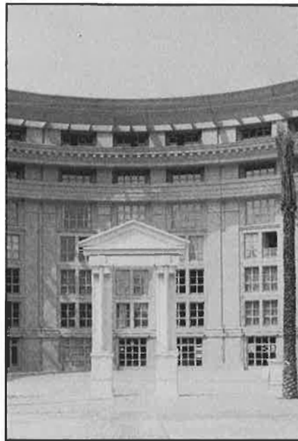
Detall d'Antigone. Montpellier.

—Perquè vaig formar un sindicat contra el SEU, que es deia Sindicato