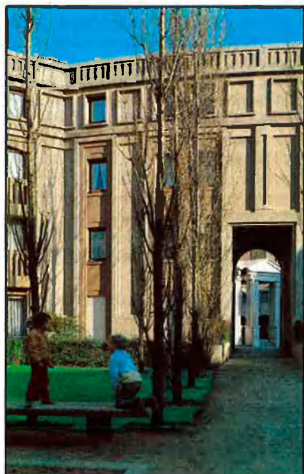
Les Arcades du Lac. Paris, 1981-1986. La primera construcció de Bofill a França. Es tracta d'un complex de 600 vivendes.