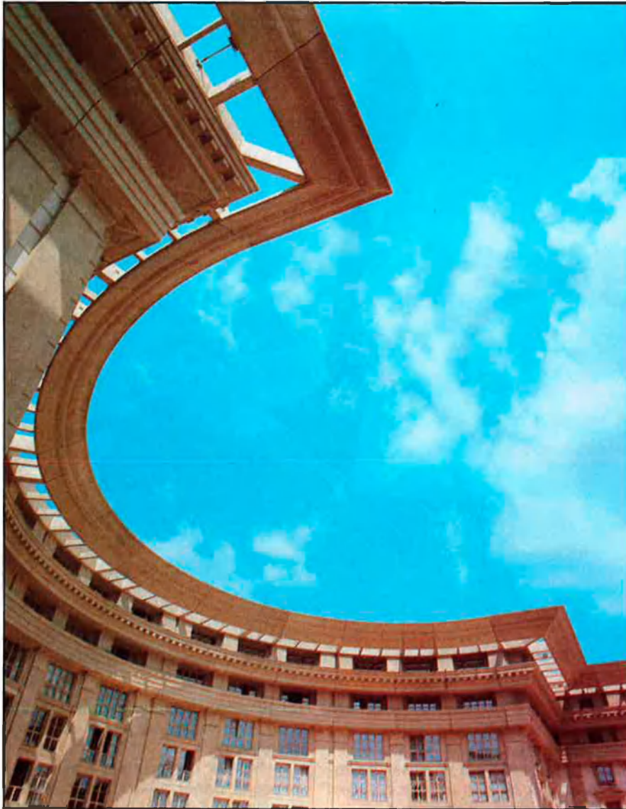
Vistes d'Antigona. Montpeller, 1979-1984. Una de les realitzacions urbanístiques més característiques de Bofill. Consisteix en un barri de nova planta a través del qual, la ciutat de Montpeller s'expandeix cap al riu Lez.

—Ser jueu té problemes, però també avantatges. A tot arreu del món que vagis sempre hi ha una comunitat jueva. Els jueus tenen respecte per l'individu i per les diferències; és un poble perseguit i sap que s'ha de lluitar per la vida, i no vol imposar la seva manera de ser perquè sap que és una minoria.