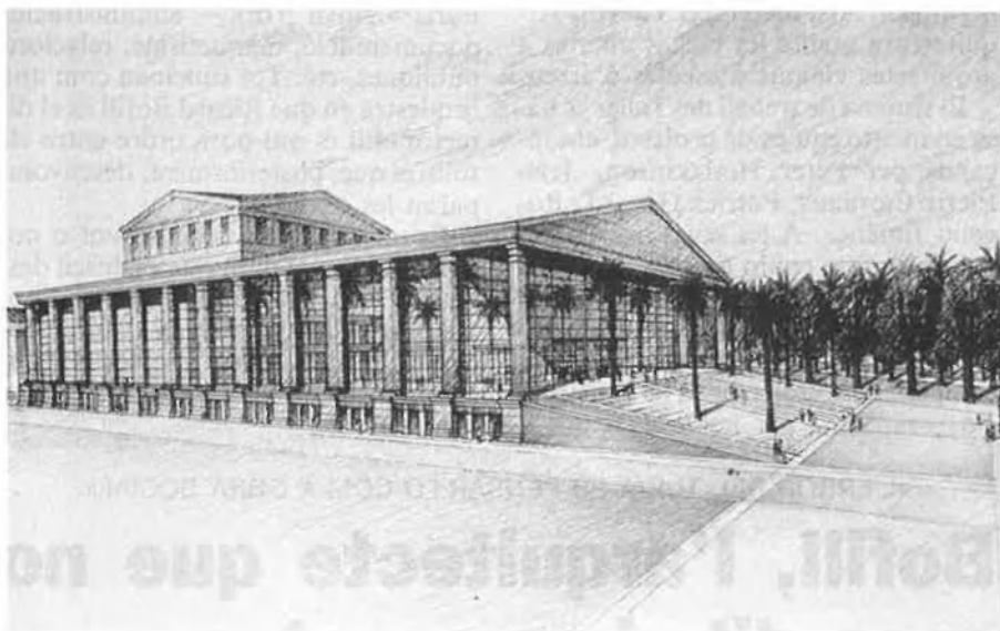
Maqueta del futur Teatre Nacional de Catalunya, un dels darrers projectes de l'arquitecte barcelonès.

els clients seran institucions públiques i, molt sovint, l'estat.