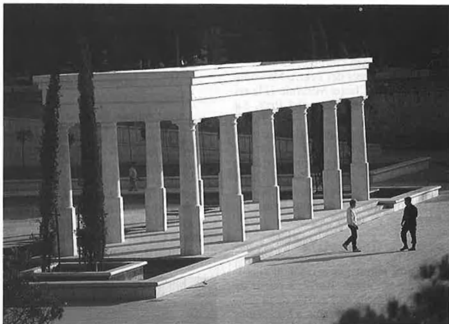
Tram del Jardí del Túria dissenyat per Bofill. Set anys després de l'elaboració inicial del projecte encara no hi ha una previsió d'acabament.

L'èxit de la proposta és tan gran que les obres, projectades per al 1992, finalitzaran aquest any. L'Ajuntament de Montpeller ha quedat prou satisfet amb el treball de Bofill per a començar amb ell un altre projecte, en el qual col·laboraran arquitectes de tot el món, i que consistirà a continuar l'expansió de la ciutat per les marges del riu i la construcció d'un port esportiu.