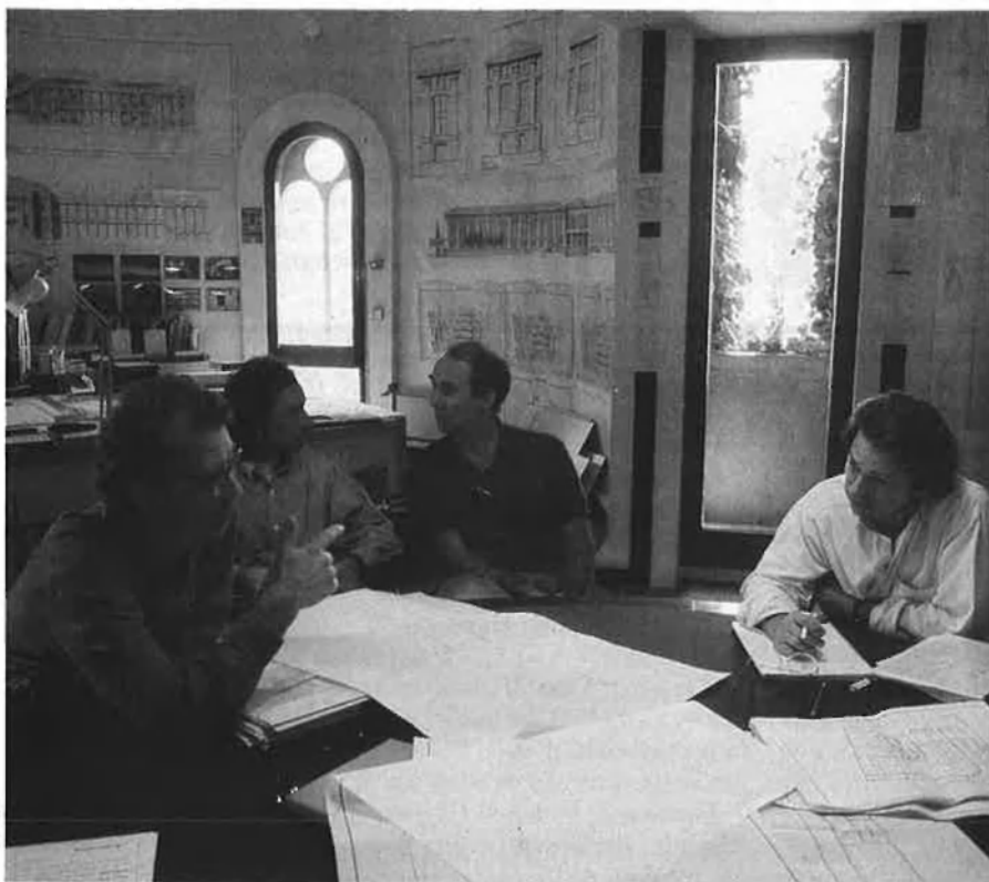
El grup d'arquitectura de Bofill, en aquesta fotografia s'hi observen alguns dels seus components, a més de realitzar projectes urbanístics dissenyen mobles, mantes, llànties...

Una arquitectura fonamentada en la imatge de les seves formes i la seva difusió posterior, ha de vigilar per aconseguir de sobreviure al consum massiu d'imatge que es dona actualment. Per això, el Taller va introduint variacions dius del seu sistema. Els darrers intents tracten de fer compatibles el llenguatge dels ordres clàssics amb alguns elements emulats pel high-tech, l'altre gran corrent del post-moviment modern. Cal constatar el bon estat de salut d'aquesta branca de l'avantguarda arquitectònica: l'edifici més visitat d'Europa —el Centre Pompidou— és l'edifici high-tech per excel·lència. El Hong-Kong Bank, la Piràmide del Grand Louvre o el Lloyds, ens demostren que ara és un moment propici per a adoptar una sèrie de tics tecnològics. És un altre risc calculat que assumeix el Taller d'Arquitectura. □