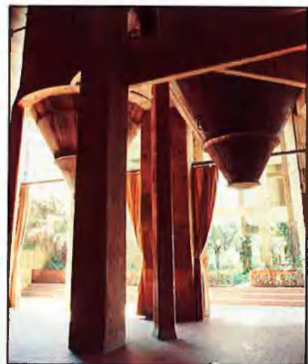
A l'esquerra, Les espases d'Abraxas. Dalt, vistes exteriors del Taller d'Arquitectura de Bofill, «la Fàbrica», creat el 1973. Amb anterioritat, l'edifici l'ocupà la factoria «Cementos Sansón».