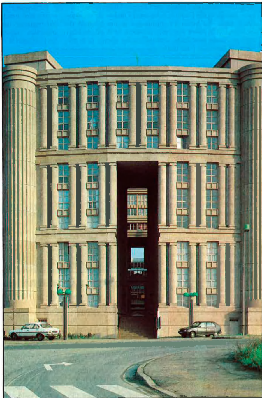
Les espases d'Abraxas. París, 1978-83. Conjunt de 591 vivendes constituït per tres edificis: El Palau, El Teatre i L'Arc, situat al voltant un espai ajardinat.

A la mateixa illa del Walden Bofill va comprar i restaurar l'antiga fàbrica de ciment que des del 1973 és La Fàbrica, la seu central del Taller d'Arquitectura. En aquest moment, a principis de la dècada dels setanta, el Taller comença la seva conquesta de França. Després de dos projectes perduts, La Citadelle i La Petite Cathedrale, en-