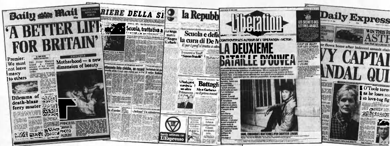
La repercussió en les pròximes Olimpíades de Barcelona és el que més preocupa a la premsa estrangera d'aquestes eleccions.