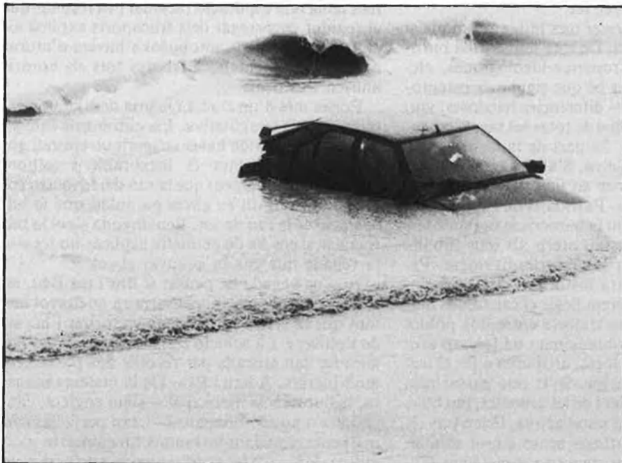
Citroën BX. Darrer viatge.

Tot plegat cinc vehicles perduts, la carretera tallada durant tres hores o més, l'evidència que cal canviar el pont de la carretera, fang i sorra més que no en vulguis, els municipals fent la ronda amb un vehicle deixat pels Mossos d'Esquadra i la natura que ens recorda que és aquí i que a Canet i el Maresme la pluja pot ser una aventura tràgica, sobretot en temps de campanya electoral. □