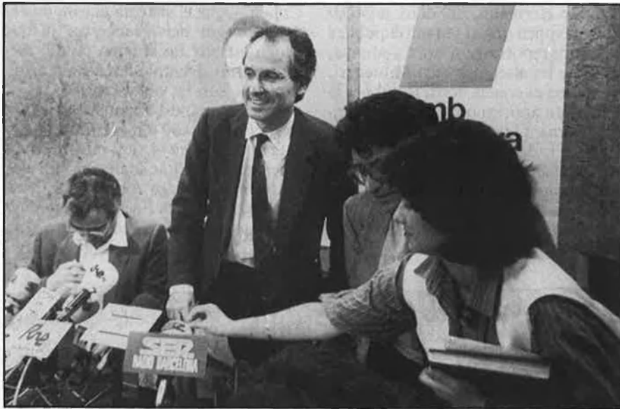
Rafael Ribó. L'avanç de les esquerres ha estat un dels trets més característics.

del PSUC, de 5 per part d'ERC i el manteniment dels 7 escons per part de l'espectre conservador espanyol dona a entendre que CiU ha obtingut vots en tots els espectres, inclòs el comunista, veritable particularitat del comportament electoral en determinats àmbits socials i ideològics.