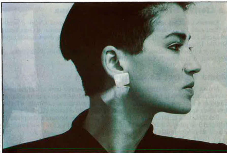
A. MASO I NTER

Entre el més destacat que es va veure en el saló on es va presentar el col·lectiu hi ha Chus Burés. Algunes de les seues peces, especialment les polseres, constitueixen un petit prodigi formal on es do-