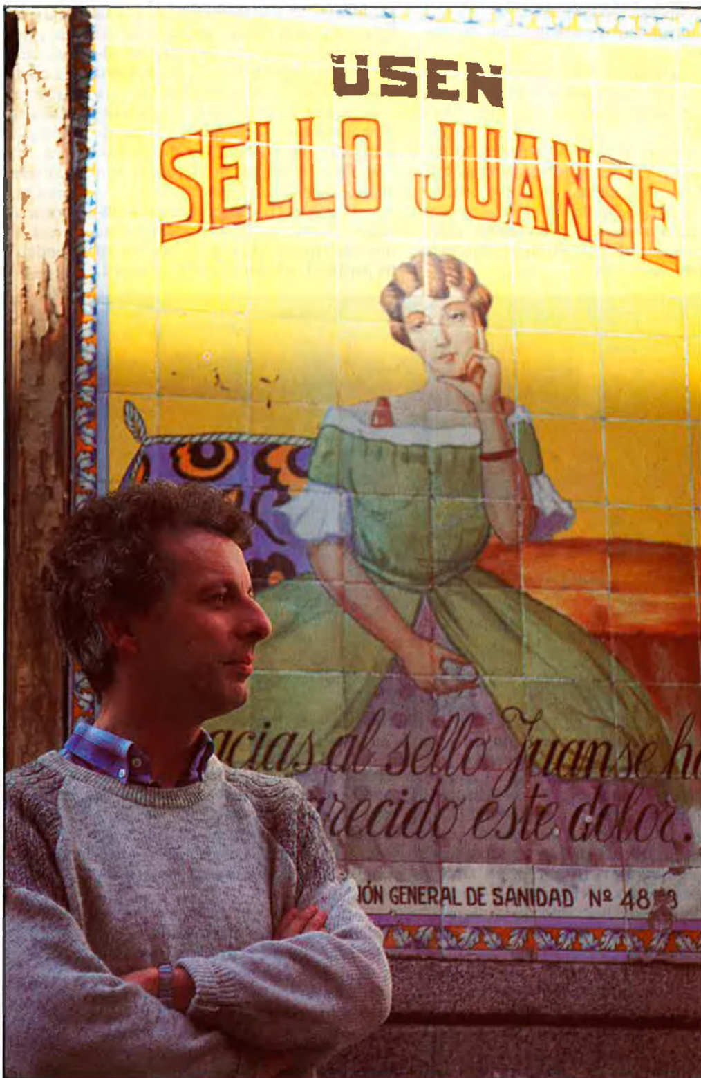
«El més important és que, de veritat, ETA i el govern espanyol comencen a negociar».

—No parle d'ell com a persona, que em sembla absolutament respectable. Però no l'hauria votat perquè Euskadiko Ezquerria és, en molts aspectes, un producte de Madrid. Com a exemples,