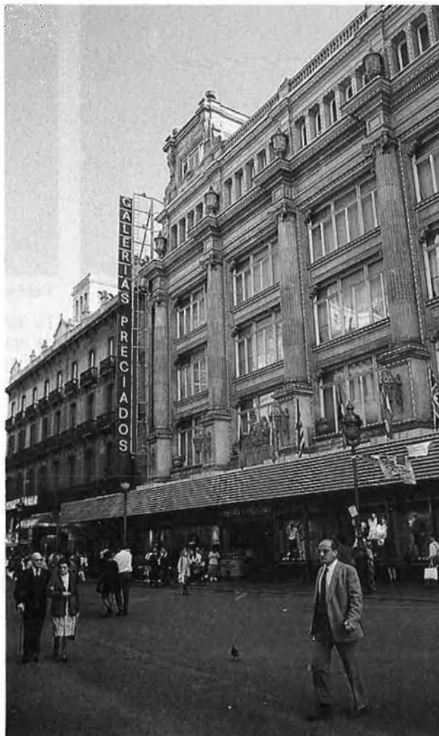
Can Jorba és un dels principals immaterials de Galerías.

lions de pessetes més del que li van costar. Un assumpte que va aixecar un mullader considerable al Congrés dels Diputats a Madrid, amb els grups de l'oposició acusant el govern del PSOE d'haver regalat Galerías al veneçolà. ¿Cal pensar que els britànics de Mountleigh s'han deixat enredar? Tot sembla indicar-ho, però probablement no és veritat.