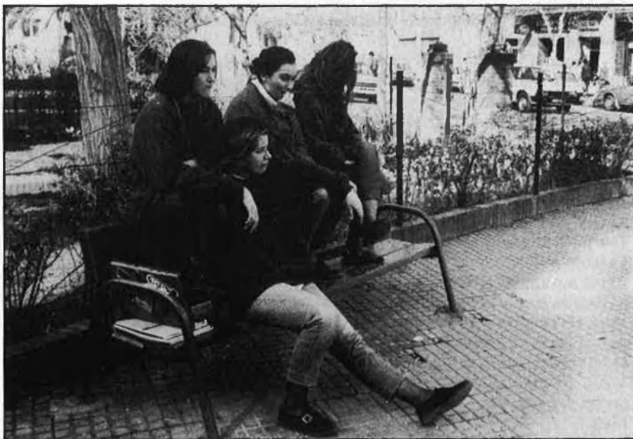
El sí a la vaga indefinida, ratificat per més del 60% del professorat del País Valencià.

El final del curs escolar 87-88 s'acomiada al País Valencià amb la vaga de caràcter indefinit convocada pels professors. Ni les converses amb el govern central, ni les intermitents negociacions amb les conselleries al llarg del curs han solucionat un problema que afecta tres sectors: professors, alumnes i associacions de pares.