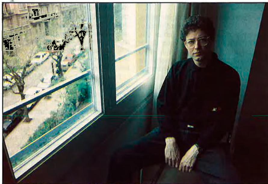
«La història de la literatura és literatura, un invent».