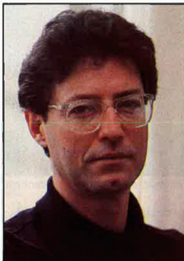
«Cal una literatura fatxenda».