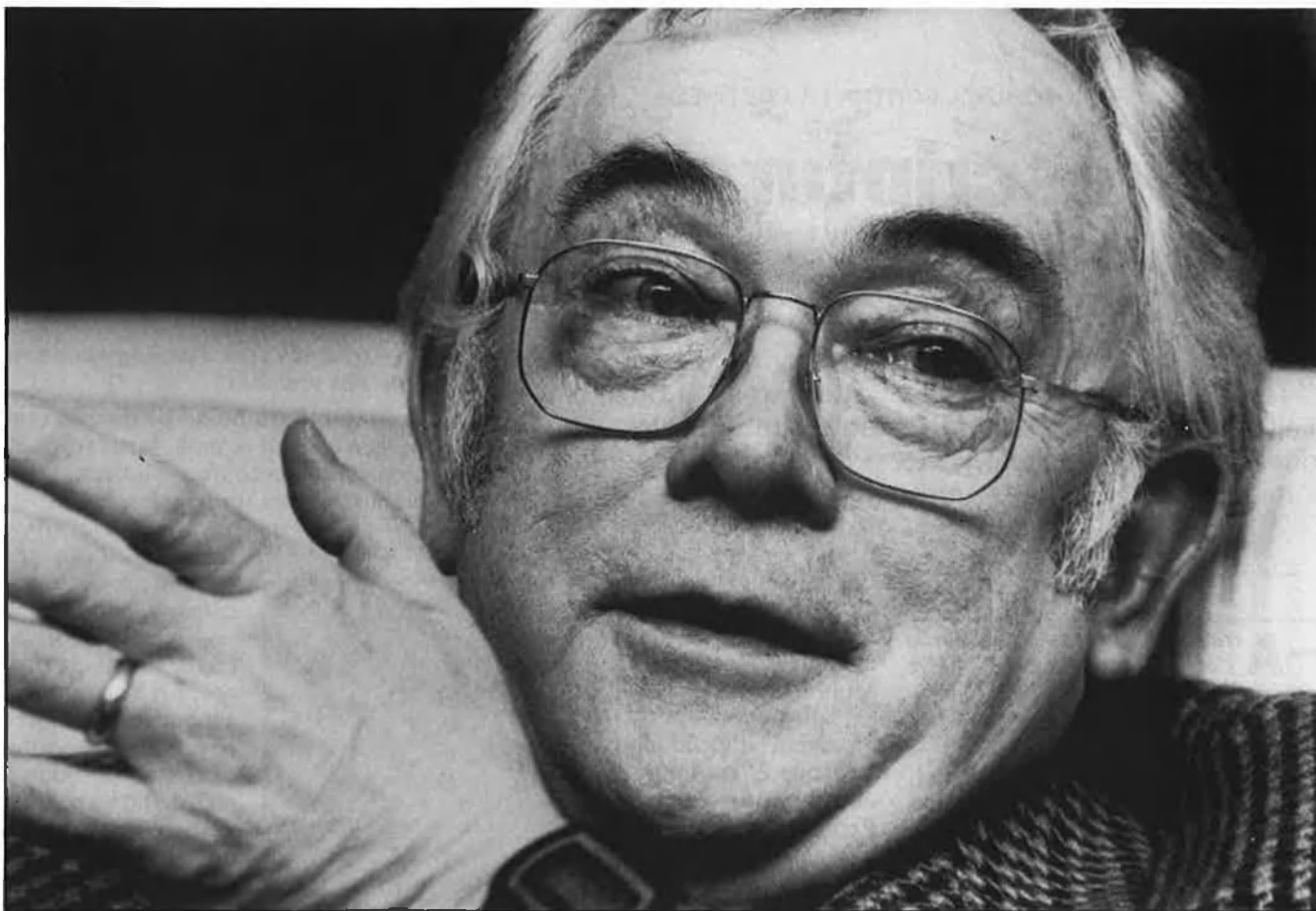
«La dominació soviètica ha destruït, en els països que controla, la cultura centreuropea i l'austro-hongaresa».

tracte pel guió de l'altra narració inclosa en el llibre El saxo baix , la titulada «La llegenda d'Emöke». Serà una coproducció entre el Canadà i Iugoslàvia i es rodarà en aquest segon país. De l'altre guió, la producció encara no està decidida. En aquests moments, amb el meu text, els productors busquen l'actor i el director i els diners per finançar-la.