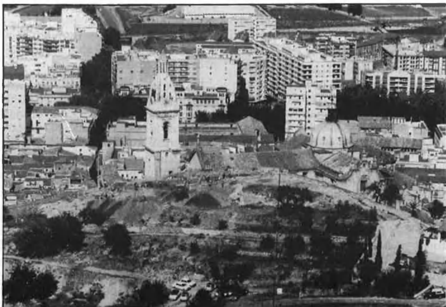
En primer pla, davant el magnífic campanar xativenc, àrea de les excavacions.

Una altra qüestió és el futur de les ruïnes. «Es tracta d'una de les ciutats romanes més importants d'aquest país que podria donar moltes dades sobre l'època. Esperem que unes ruïnes d'aquesta envergadura es respecten i es puguin mostrar al públic i als especialistes. Que no es faça el més fàcil, que és tapar-les». □