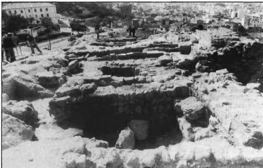
Aspecte de les habitacions tretes a la llum.

var la resta dels 300 metres de muralla. L'equip encapçalat per J. M. Martínez compta amb dos arqueòlegs i 10 obrers. Quan està a punt d'acabar la campanya encara queden uns setanta metres per excavar, cosa que fa pensar que el començament del projecte dels arquitectes s'haurà d'ajornar.