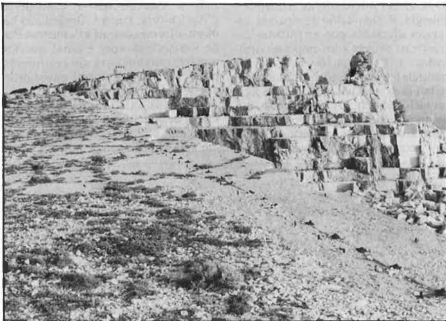
LA MOLA DE MURAR EN PERILL