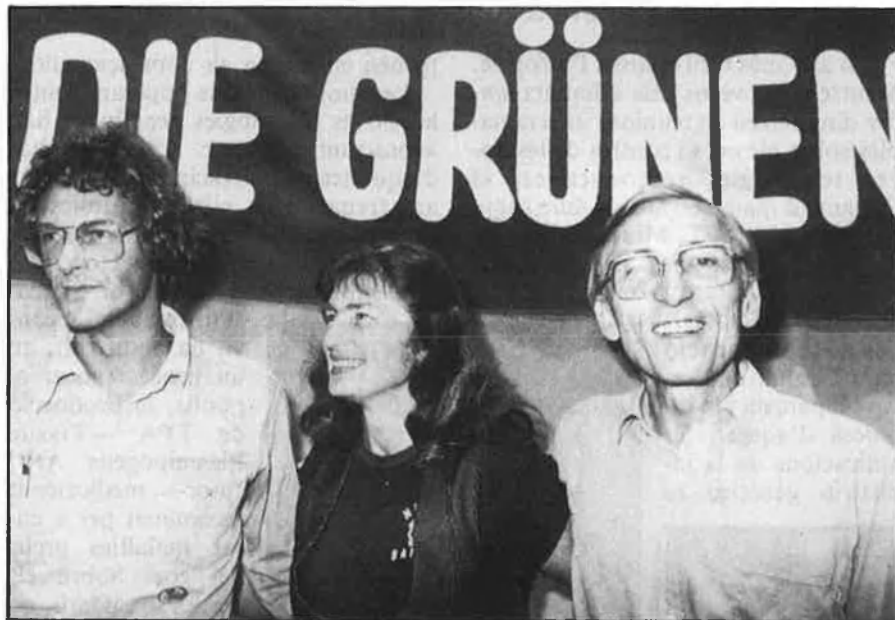
Els Verds han criticat durament les noves tecnologies genètiques.

A nivell internacional es fundà, el 1984, el Finnet —Xarxa feminista internacional sobre les noves tecnologies reproductives—, xarxa que més tard, el 1985, canviaria el nom pel de Finrage —Xarxa feminista internacional de la resistència contra les tecnologies genètiques i reproductives— com a plataforma internacional per a portar a cap la resistència.