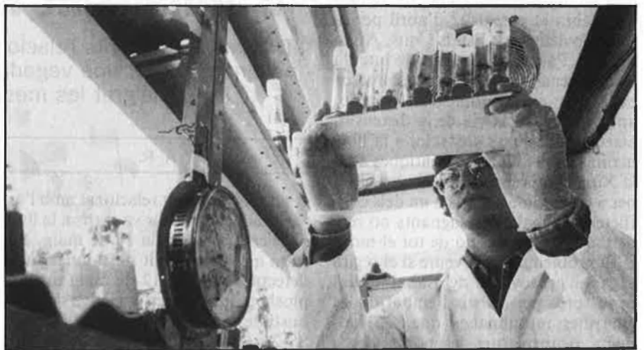
Amb les bases de l'enginyeria genètica ja és possible seleccionar la raça.

Investigadors i representants de la política i l'economia tenen interès en l'ús d'aquesta ciència com a arma, especialment els militars. Teòricament avui dia ja és possible la construcció d'armes ètniques, armes que, a causa