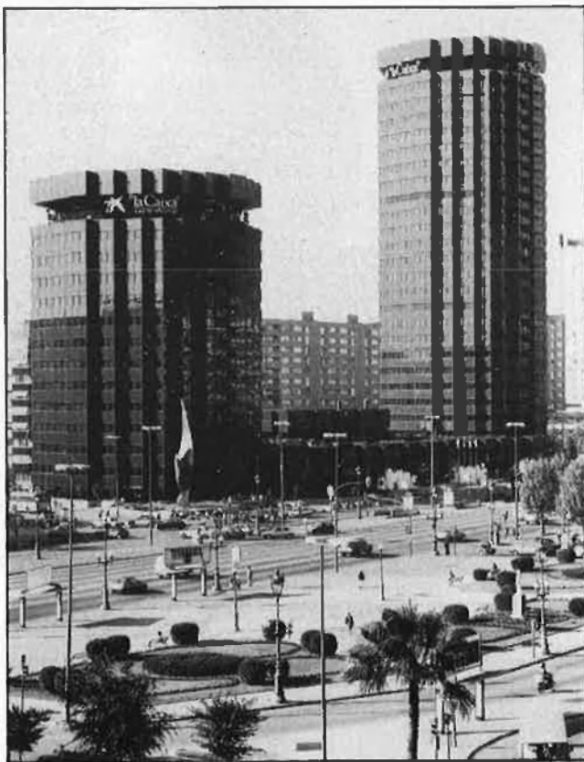
La Caixa, de Barcelona a París, passant per Palencia i Mònaco.

Una frase que va i ve, com un leitmotiv a l'expressió de Vilarasau, és la del «mite del territori històric», és a dir, aquestes restriccions que la legislació espanyola ha imposat a l'expansió de les caixes, obligant-les a quedar-se dins la seva regió tradicional i no sortir-ne per cap motiu. Situació que —com ell mateix explica molt bé— la història no justifica, ja que fou després de la guerra de 1936-39, amb la instauració del statu quo bancari, que les caixes veieren com quedava congelada qualsevol possibilitat d'expansió: de fet, en la seva història anterior, la Cai-