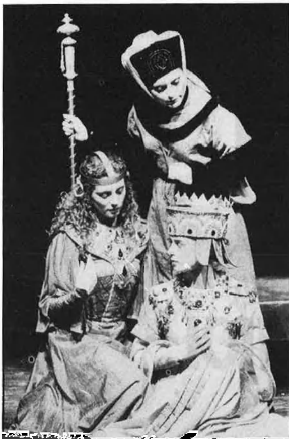
«Tirant lo Blanch», coproducció conjunta dels centres dramàtics del País Valencià i Catalunya.