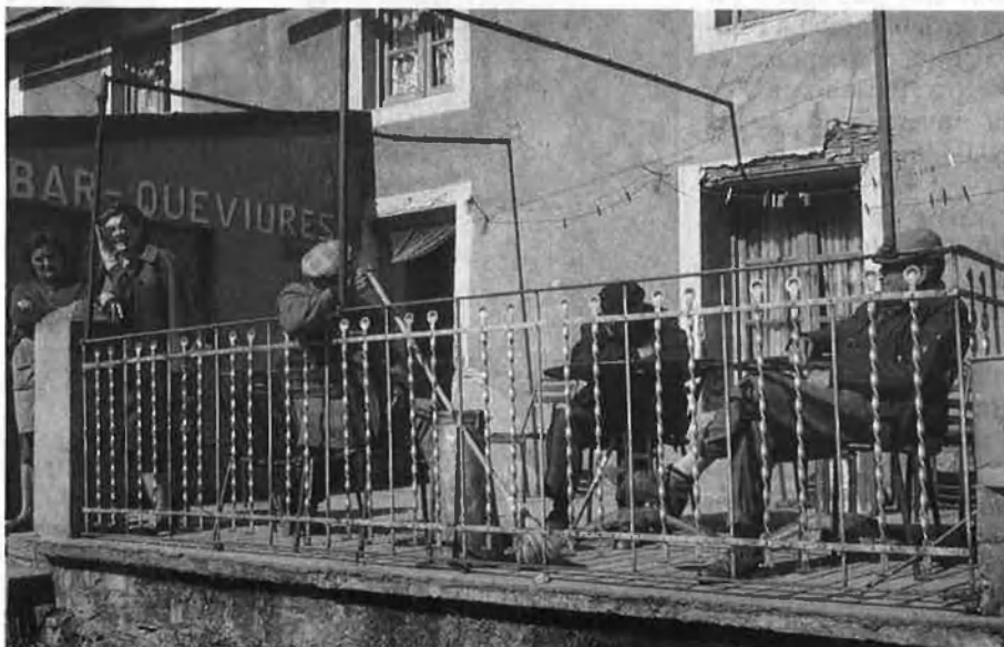
Actualment, només el 16,8% de la població del principat és andorrana.

L'informe proposa solucions al problema que s'acosta encaminades a evitar la desaparició progressiva dels andorrans. D'una banda, la reducció de la immigració, que haurà de ser objecte de control estricte i, de l'altra, l'absorció de nous andorrans que formen la llei que dona accés a la nacionalitat