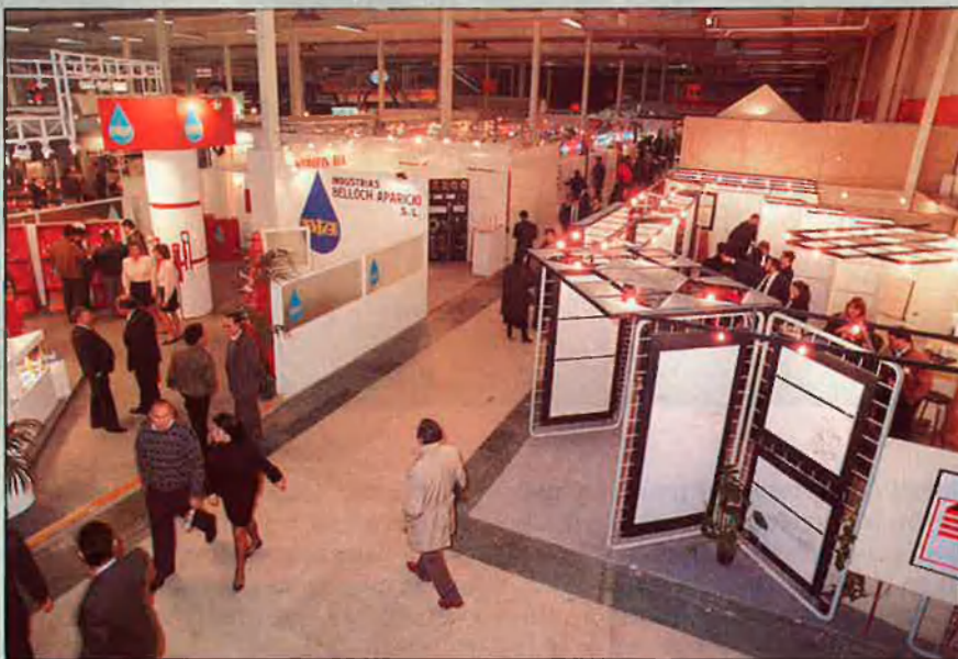
La Fira suposa el manteniment de 10.000 llacs de treball.

A partir d'ací comença una nova etapa per a la fira valenciana, tant per l'augment de certàmens monogràfics com per la seva importància exterior. De FEJU, naixen les fires FIME, el 1967, que després es convertirà en FIMI, la fira de moda infantil el 1982 i Didastec, 1973, que passarà a denominar-se DIPA, fira de la papereria, l'any 1979. El 1963, FIM, que passarà a SIMMA, el 1971, FIMMA en 1974 i finalment FIMMA Maderalia, fira de maquinària per a la fusta i la indústria del moble, el 1980. El 1965 es crea Cevider, que el 1983 es converteix en Cevisama, fira del vidre, ceràmica, marbre, sanejaments i d'altres. El 1966 apareix FIAM, fira de