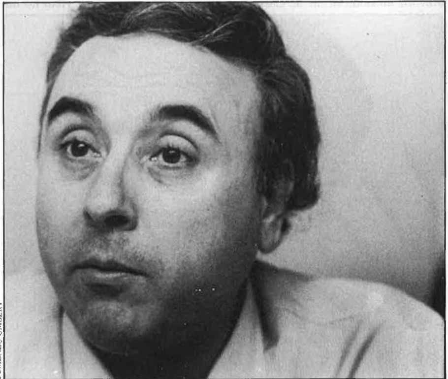
«Cinquanta-set anys després, l'ideari d'Esquerra continua sent el de Macià».

—Sembla que aquesta vegada Esquerra vol imposar una imatge més radical en molts aspectes.