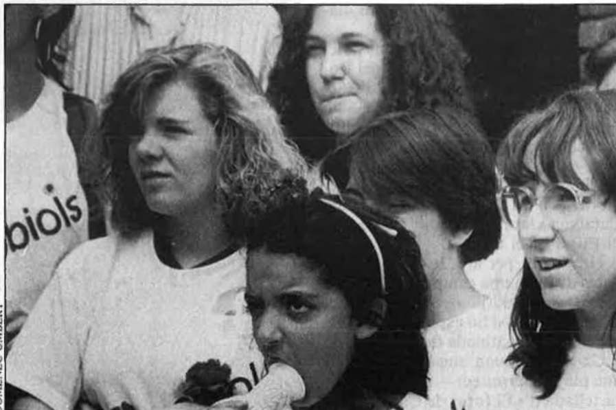
Entusiasmar l'electorat amb un missatge possibilista: objectiu d'aquesta campanya.

Les llistes es completen amb Joan Reventós, president del partit i candidat per Tarragona, i que assegura ha-