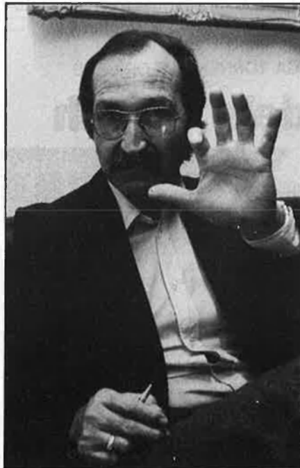
«No es pitjor una claveguera que una presó».

— Vicente Aranda ha dit que no vol filmar El Lute III per no parlar del que