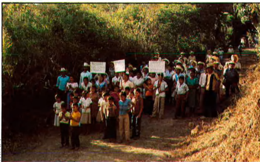
Pobladors de San Fernando. Recepció de la delegació.