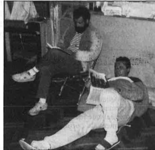
Els treballadors estan patint una greu situació econòmica a causa del conflicte.

Però, la situació més dolenta, la pateixen els treballadors en el clima que es viu al poble. Els veïns critiquen obertament la posició dels treballadors,