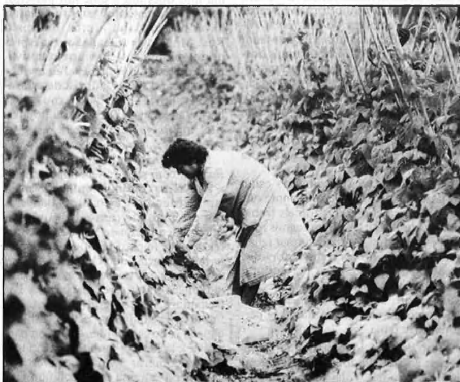
Les activitats agràries a l'illa duen camí de desaparèixer.

agraris l'hem establert d'acord amb les definicions de la FAO. Les mercaderies incloses són els aliments, els productes agrícoles, els materials agrícoles i la maquinària agrícola. Els anuaris d'estadística agrària del MAPA adopten les mateixes definicions.