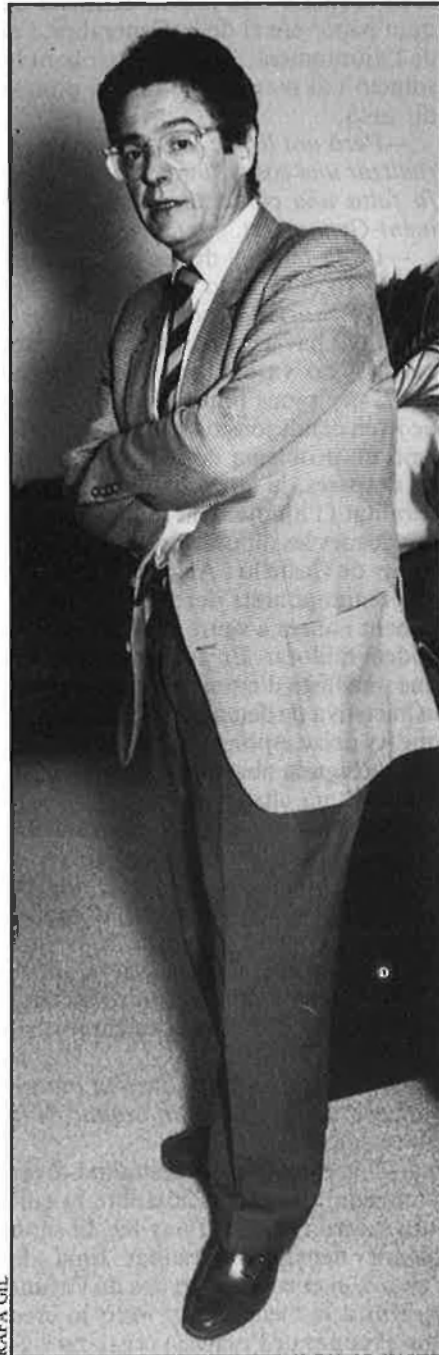
«Més que decebut, el que estic és sorprès de les tortuositats de l'administració».

nia el programa era la seua presentació i la seua coordinació, perquè potser en el seu moment no es va dir que aquesta commemoració és de tots els valencians. Sempre hi ha hagut un divorci entre el món rural i l'urbà en el nostre país, i de fet, la implantació de