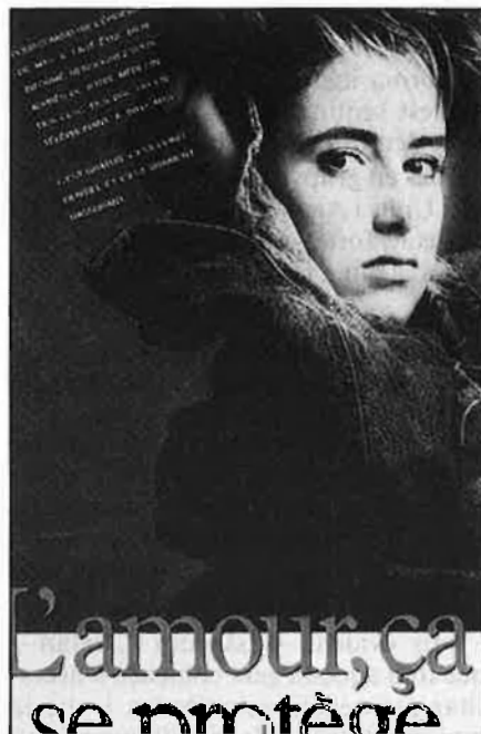
Campanya llançada per l'estat de Canadà.

Tant sobre aquesta síndrome com sobre les futures complicacions neurològiques i físiques que poden arribar a desenrotllar les persones afectades per Sida, els investigadors tenen en l'actualitat pocs elements de judici. No ens ha d'estranyar si tenim en compte els anys que han tingut de passar abans que els especialistes arribaren a relacio-