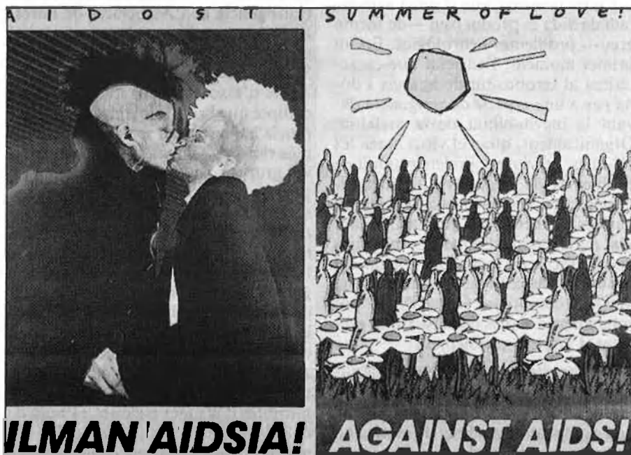
Campanya llançada per l'estat de Finlàndia.

nar la sífilis, que comparteix amb la Sida el seu caràcter infeccios, amb les paralitzacions cerebrals que certs malalts desenrotllaven anys després d'haver superat aquesta afecció venèria.