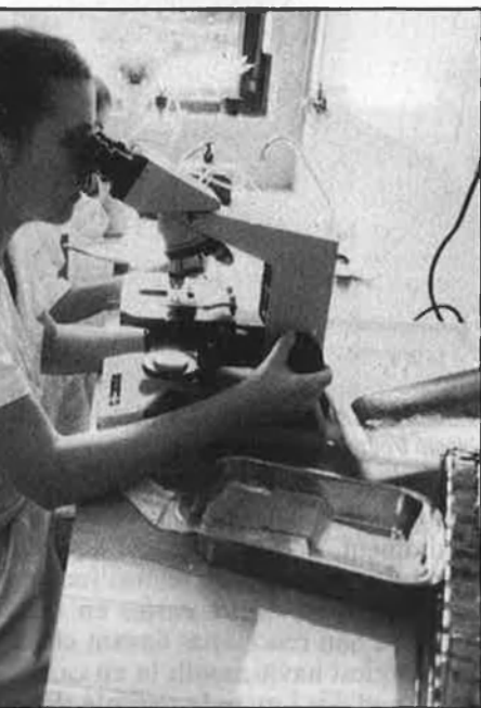
La cursa dels laboratoris per la vacuna ja ha començat.

tre la malaltia, tanmateix, la realitat és que no hi ha res que pugui vèncer-la de manera definitiva.