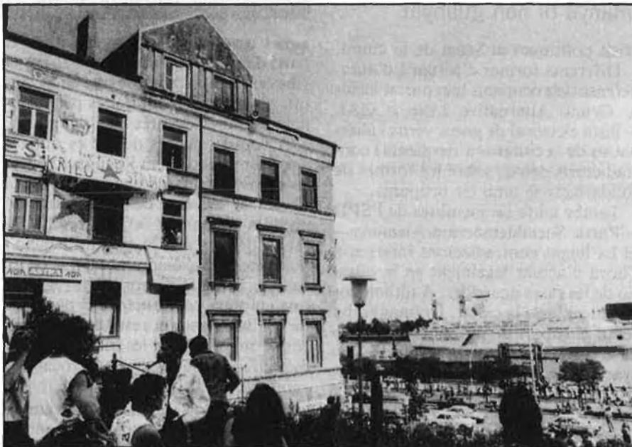
Les autoritats d'Hamburg tenen prevista la remodelació de la zona portuària de la ciutat.

Amb la crisi econòmica, la ciutat portuària i les drassanes han per-