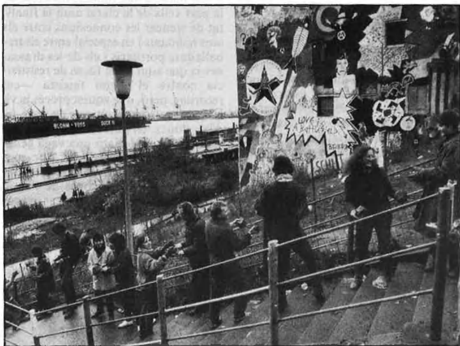
Dalt, antena emissora de la «Radio Hafenstrasse». Baix, construcció de barricades al voltant de les cases ocupades:

La línia de desallotjament i enderrocada inciativa pel Senat de la ciutat i l'empresa SAGA es manté també el 86. El senador de la Construcció d'Hamburg afirma que les cases seran definitivament enderrocades en acabar els contractes de lloguer al desembre del mateix any. Davant d'aquest ultimàtum es funda per part de diferents organitzacions —la GAL, sectors de l'SPD, el DKP (Partit Comunista Alemany) i grups de veïns— una iniciativa per defensar projectes d'estatge a Hamburg. En un comunicat d'aquesta iniciativa s'exigeix que el Senat canviï la política contra la Hafenstrasse, no desallotge ocupants i impedeixi que la policia hi torni a entrar. A finals de l'estiu, cinc-cents policies entren en les cases per les teulades i detenen una dotzena de per-