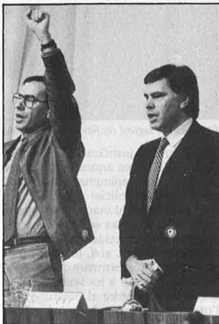
Guerra i González perden credibilitat.

Però en les files del CDS, que apareixia estancat en els resultats obtinguts el juny de 1986, i en les files d'AP, on l'expectativa de vot també baixava, encara que més moderadament que en el cas socialista, els sondejos han significat un estímul a la crisi interna. Al partit del duc, els partidaris de José Ramón Caso, actual secretari general i home que escriu al dictat d'Adolfo Suárez, i els partidaris de Fernando Castedo, majoritaris a Madrid, han fet lectures distintes de les dades de les enquestes, mentre que, en AP, s'han redoblat els esforços del sector contestatari per trobar una alternativa a Hernández Mancha que, en paraules de Miguel Herrero y Rodríguez de Miñón, «pose alguna cosa més atractiva en el cartell electoral pròxim».