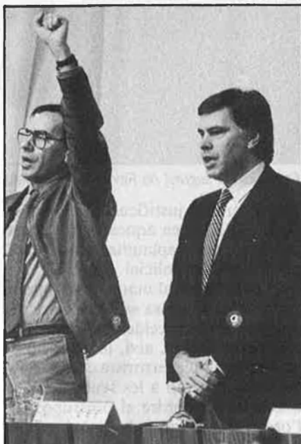
Guerra i González perden credibilitat.

Però en les files del CDS, que apareixia estancat en els resultats obtinguts el juny de 1986, i en les files d'AP, on l'expectativa de vot també baixava, encara que més moderadament que en el cas socialista, els sondejos han significat un estímul a la crisi interna. Al partit del duc, els partidaris de José Ramón Caso, actual secretari general i home que escriu al dictat d'Adolfo Suárez, i els partidaris de Fernando Castedo, majoritaris a Madrid, han fet lectures distintes de les dades de les enquestes, mentre que, en AP, s'han redoblat els esforços del sector contestatari per trobar una alternativa a Hernández Mancha que, en paraules de Miguel Herrero y Rodríguez de Miñón, «pose alguna cosa més atractiva en el cartell electoral pròxim».