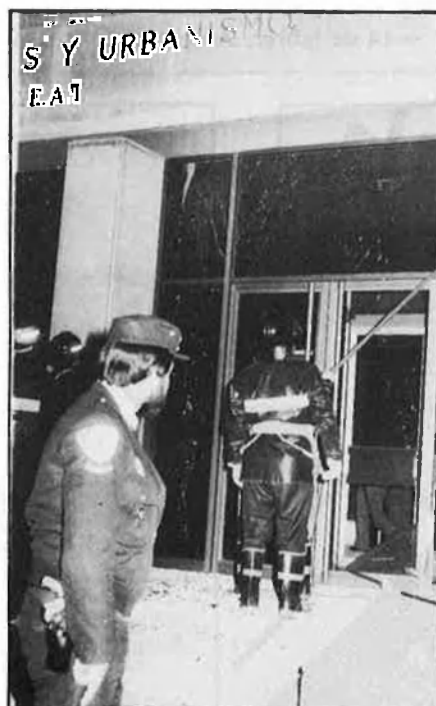
Atemptat de Terra Lliure a València.

cial d'Educació i contra les oficines d'Enher a Gràcia (Barcelona).