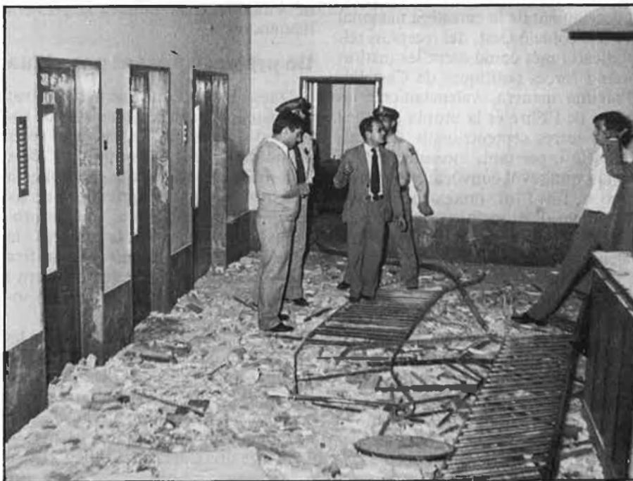
Conseqüències d'un atemptat de Terra Lliure a Barcelona.

—25 de juliol. Artefacte explosiu contra l'oficina bancària del Banco Hispano Americano a Castelló de la Plana.