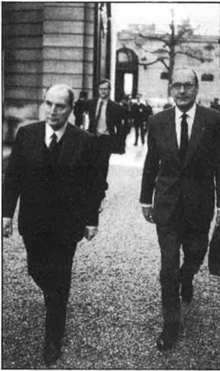
Chirac s'enfronta a Mitterrand amb un clar desavantatge numèric.

clàssiques i les previsions polítiques durant els pròxims anys.