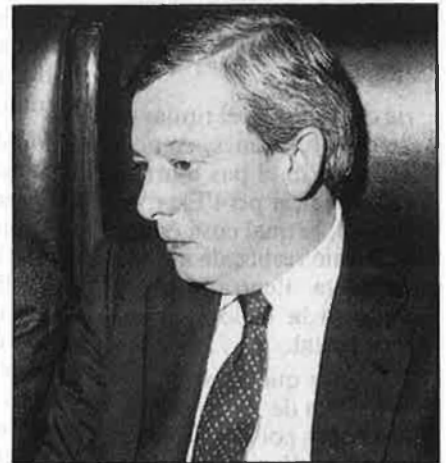
El ministre Carlos Solchaga.

El tercer home, Josep Borrell , segueix, i ja sona per a un càrrec de ministre en una pròxima remodelació. Ell