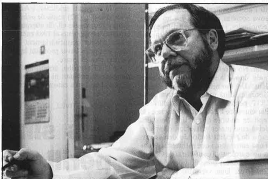
«Estem en una situació de repensar què han estat aquests anys».

—Aquest és un altre dels reptes clarríssims que tenen els sindicats. Cada vegada hi ha més gent aturada, i amb