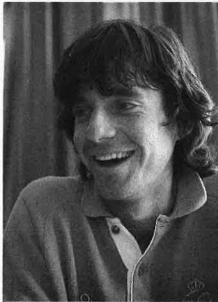
«No m'agrada això de tenista madrileny fincat a Barcelona».