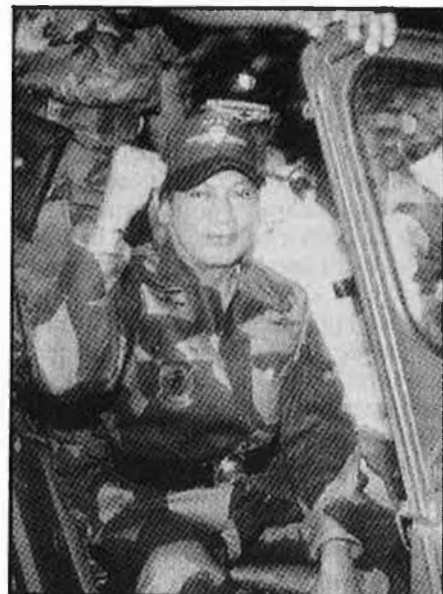
El general Manuel Antonio Noriega.

L'actuació de la DEA i les últimes sancions econòmiques imposades per Washington han enterrat definitivament el centre financer de Panamá, la principal força econòmica d'aquest pe-