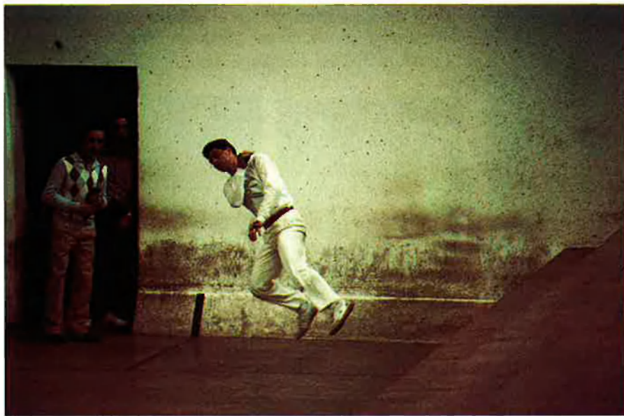
«Com a manifestació cultural tenim més dret a les Olimpíades del 92 que ningú».

—No sé què dir-te, però, mira, estem en un món molt materialista i els diners manen. No sé fins a quin punt la pilota valenciana pot interessar en altres llocs, de cara a la televisió, per exemple. En qüestió de diners no podem competir. I aquesta és la llàstima. Ara, com a manifestació cultural, sí que hem de ser-hi presents. Tenim, en això, més dret que ningú. □