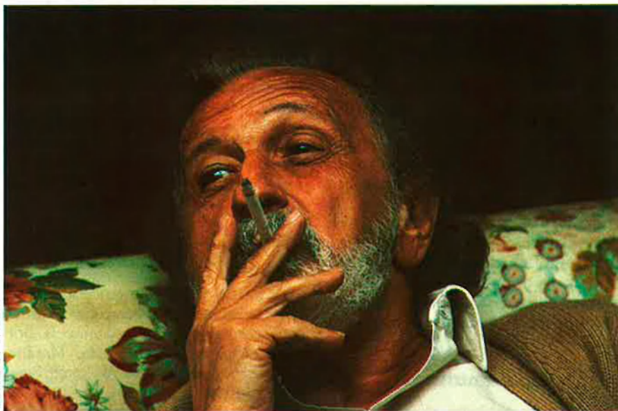
«Cal ser una mica rancuniós, és aristocràtic».

—Sí, Suárez és molt llest, i a més pense que és un home amb el qual el país havia estat injust. Era un moment en què era atacat per les grans institucions del país, la banca, l'exèrcit i l'església, mal vist per tothom... i em va convèncer. Deia que tots dos faríem un gran tàndem, presentant-nos junts per Madrid, i hi vaig accedir, segurament equivocant-me. Sense ser del CDS em vaig presentar segon a la llista de Madrid, però no vaig sortir, només va sortir Suárez.