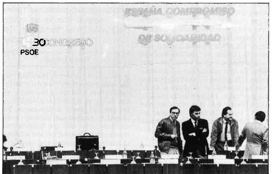
La institucionalització de l'estat de les autonomies ha reforçat el projecte de reorganització de la nació espanyola.

La reflexió que hem fet també permet aclarir les relacions entre nacionalisme i universalitat que ens plantejàvem a l'inici. No es pot atacar el nacionalisme català de particularista en nom de la universalitat pura i abstracta. A un nacionalisme sempre se l'ataca des d'un altre nacionalisme. Si el nacionalisme català —sense identificar-lo amb cap opció política concreta— no sedueix tant segons quins intel·lectuals és que ara el projecte espanyol els sedueix més que en el passat. Això em sembla irrefutable com a generalització.