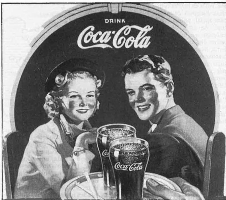
De Sibèria a Sud-àfrica i de l'Índia a Canadà.

I aquesta és una part de l'estat de la qüestió (la qüestió de l'estat), que convindria no oblidar en cap moment. Quan, per exemple, des de la identitat reconeguda de l'Estat espanyol, els catalans som acusats de «particularisme», és pel simple fet —conscient o no— que la ideologia de l'estat no ac-