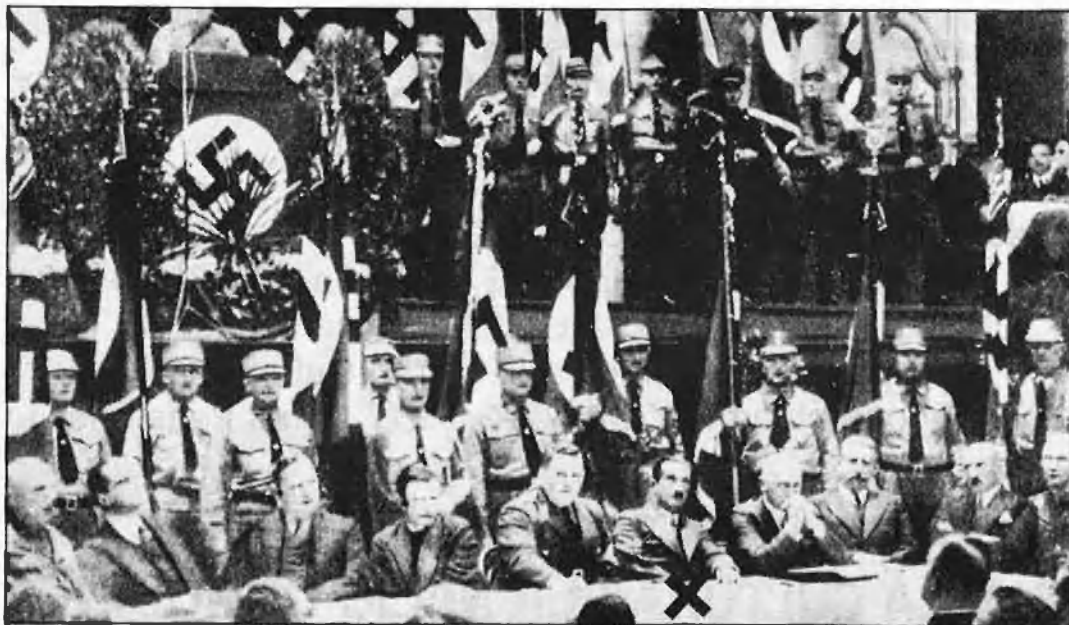
Heidegger en la proclamació com a rector d'universitat en el 1933.