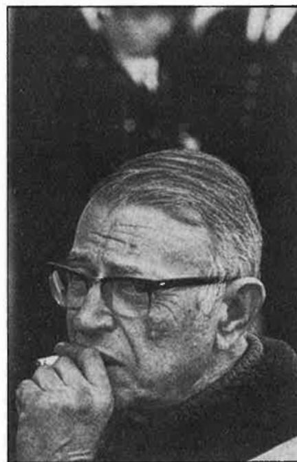
Sartre. Amb Heidegger, «pel camí raonable».

El 1933, l'any que el partit nacional-socialista es feia amb el poder a Alemanya, Heidegger esdevé un factor polític del nou estat. No solament no va ser censurat mai, sinó que va ser citat sovint. Els seus pragmàtics discursos en