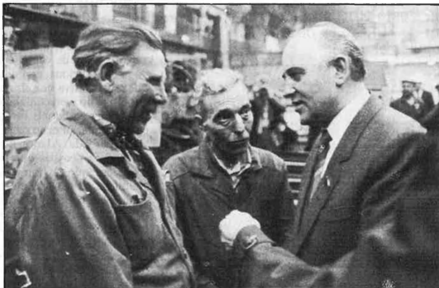
Gorbatxev, a més de reformes econòmiques, revisa la història soviètica.

Els vint-i-un condemnats en el procés del «bloc de dretans i trotskistes» (divuit van ser afusellats) van ser acu-