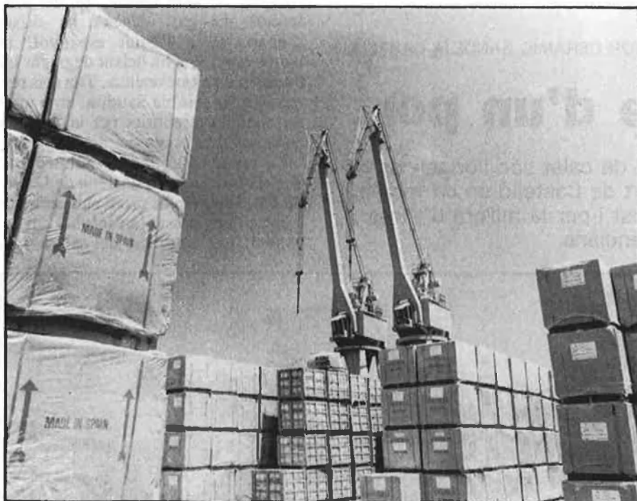
El port de Castelló ha de recuperar el sector tauleller.

Per tant, el president de la Societat Estatal d'Estiba i Desestiba del Port de Castelló s'ha marcat un repte: «Cal recuperar el mercat tauleller. El problema és que els productes ceràmics ixen en contenidors i al Port de Castelló no s'atenyen quantitats suficients perquè vinguen les línies regulars. La Societat d'Estiba està preparant un pla que passa per convèncer les empreses taulelles perquè deixen d'anar a València a canvi d'oferir uns preus competitius que, alhora, estimulen les empreses regulars a passar per Castelló. En realitat el peix es mossega la cua: les empreses no vénen a Castelló perquè no hi ha línies regulars i aquestes no passen per Castelló perquè les indústries prefereixen València pels seus preus. Nosaltres tenim d'oferir uns preus que facen canviar l'actitud de les dues parts. Si ho aconseguim, jo augure un bon futur per al port de Castelló». □