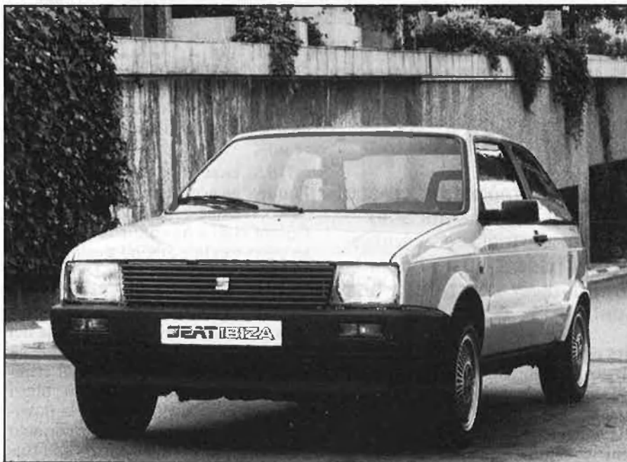
El model Ibiza ha augmentat les vendes un 46%.

Citroen ha estat durant el 87 també la marca que proporcionalment ha augmentat més les vendes al mercat espanyol, un 69%, encara que continua tenint només una part molt petita del repartiment del mercat que no arriba al set per cent.