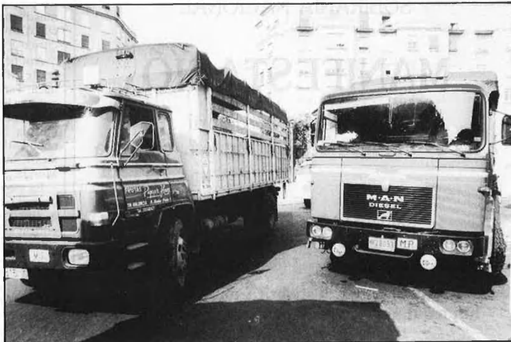
Algunes organitzacions agràries han anunciat que cremaran camions.

Però bé, parlant concretament de les possibilitats que té l'economia marroquina, una primera cosa apareix clara i diàfana: els preus laborals són efec-