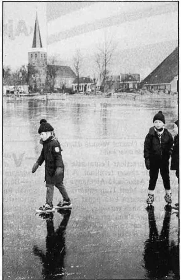
Un 80% dels holandesos està a favor de l'eutanàsia.

Als Països Baixos es va presentar una llei de despenalització el 1986, però no va prosperar. En l'actualitat hi ha un projecte en estudi que podria representar, si s'arribés a aprovar, que els Països Baixos serien el primer país on l'eutanàsia fos contemplada per la legalitat. A Amsterdam hi ha un hospital infantil on el doctor Voute ha declarat que ha ajudat a morir joves amb edats des dels 12 fins als 20 anys. En aquest país s'aplica anualment l'eutanàsia a 6.000 persones, i segons altres fonts, aquesta xifra podria ser de 12.000. El debat es va iniciar el 1973, i un 80% de la població holandesa es-