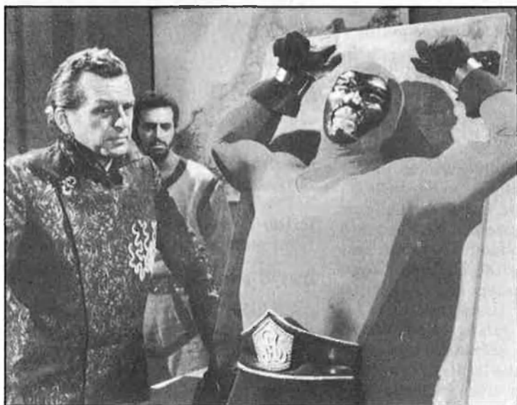
A la dreta, «Batman». A l'esquerra, una de les múltiples seqüeles.

De música, es reediten discos d'una gran quantitat d'obscureïts dels cinquanta i seixanta (tot i que, en la meua opinió, els autèntics trash-sounds són els de la música «disco», ¿on és Dee D. Jackson?). Quant a còmics, les edicions originals de superherois, horror, ciència-ficció, i animals humanitzats (Walt Disney, Hanna-Barbera...) agafen màximes còtitzacions. I, punta de l'iceberg, prova que no és un fet de quatre rates col·leccionistes, les cadenes de televisió de tot el món reposen els vells telefilms. Frueixen d'un gran culte, de les antigues, Dark shadows , High Chaparral , Cassidy Class , Charlie's Angels i l'increïble Star Trek ( La conquista del espacio , fou l'imperialis-