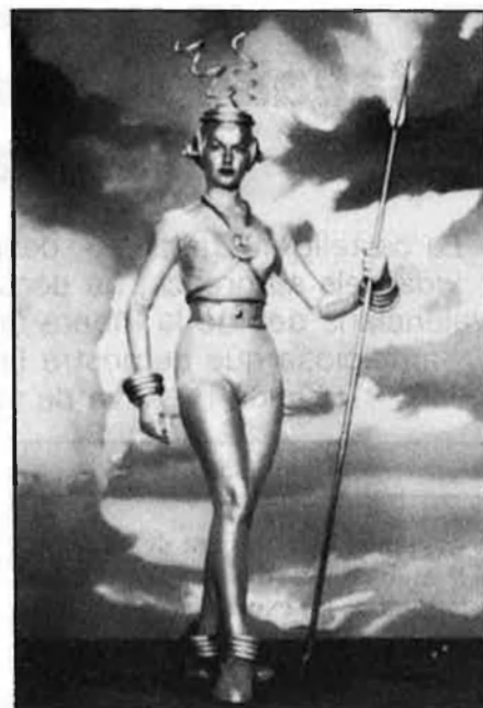
A l'esquerra, Jayne Mansfield, encarnació del «trash».

això no és barat, el tipus es guanya les garrofes treballant de matí i fins a mitja tarda d'executiu en una multinacional —ja no en parlem més, del conservadorisme latent en tota aquesta història—, per aconseguir els diners necessaris per satisfer la seva dèria col·leccionista, i submergir-se la resta del temps dins l'univers de la trash-culture .