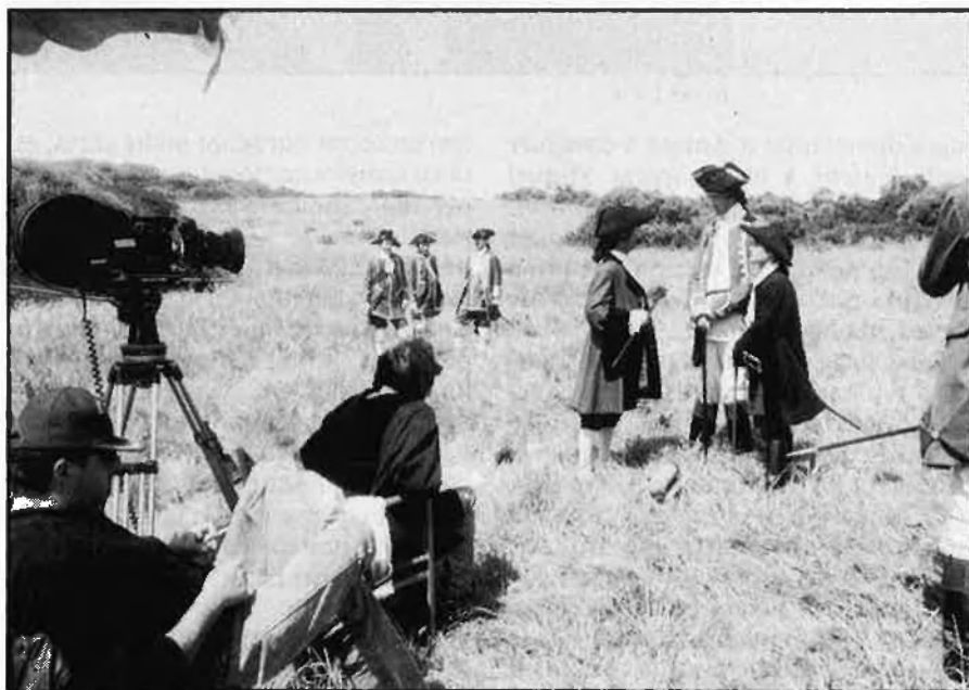
«El vent de l'Illa», l'últim gran film del cinema català.

Per fer arribar la pel·lícula, una volta acabada, al públic, calen les distribuïdores, i la relació d'aquestes amb els productors és un tema molt delicat. El mateix distribuïdor que porta una pel·lícula nord-americana de masses, porta una pel·lícula catalana minoritària i totes dues han de passar pel mateix circuit i tenir el mateix tipus de promoció. És difícil que les coses funcionin així. El productor ha de fer un