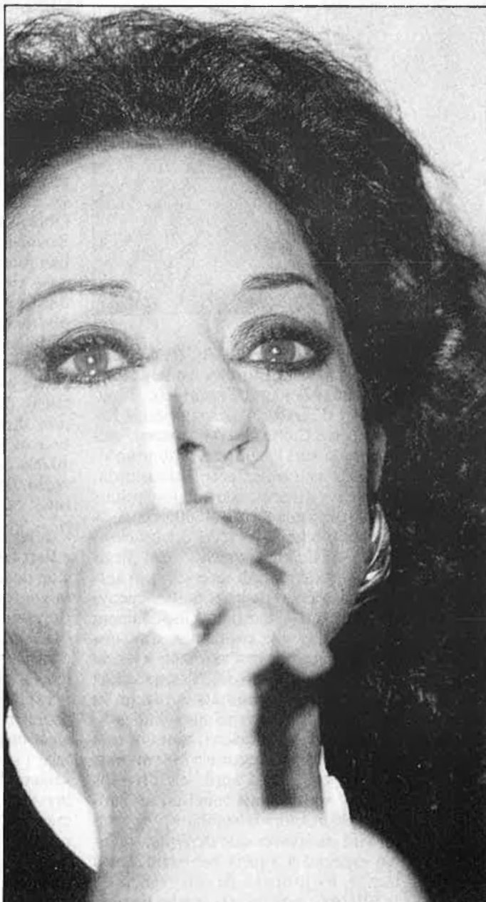
La «Faraona», víctima de la reforma.