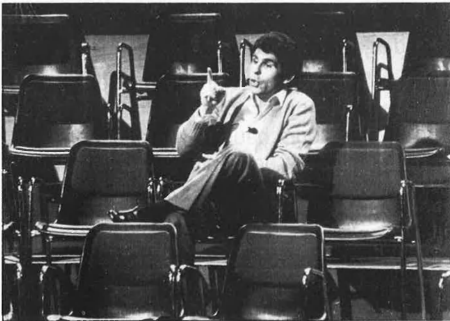
Pedrito Ruiz no va tardar a defensar-se de l'anomenat «terrorisme fiscal».

Sembla que també, amb la intenció de trobar una millor situació financera Pares Hermanos, S. A., una societat que es dedica des de l'any 1952 a la importació i venda de maquinària