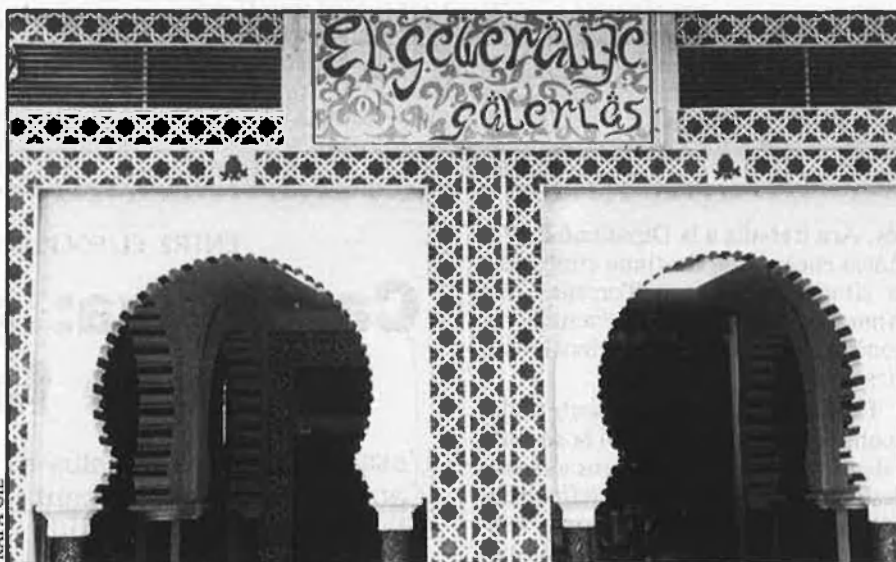
La penetració cultural del fenomen andalusí continua fent-se a través dels circuits comercials.

La comunitat andalusa al País Valencià supera les 280.000 persones, 120.000 de les quals es troben agrupades en l'àrea metropolitana de la ciutat de València. Molts d'aquests andalusos continuen vinculats a la seua terra d'origen mitjançant associacions com la «Casa de Andalusia». Les entitats en qüestió es veuen molt afavorides per la política de subvencions que dirigeix la Junta de Andalusia i que potencia la creació de guetos folklòrico-culturals. Amb aquesta mena de nuclis aïllats, no es concep una política d'integració de la societat andalusa en la societat valenciana; en canvi, sí que s'aconsegueix una desconexió cultural cada vegada més alarmant. Els guetos també funcionen entre les mateixes organitzacions, ja que les relacions en-