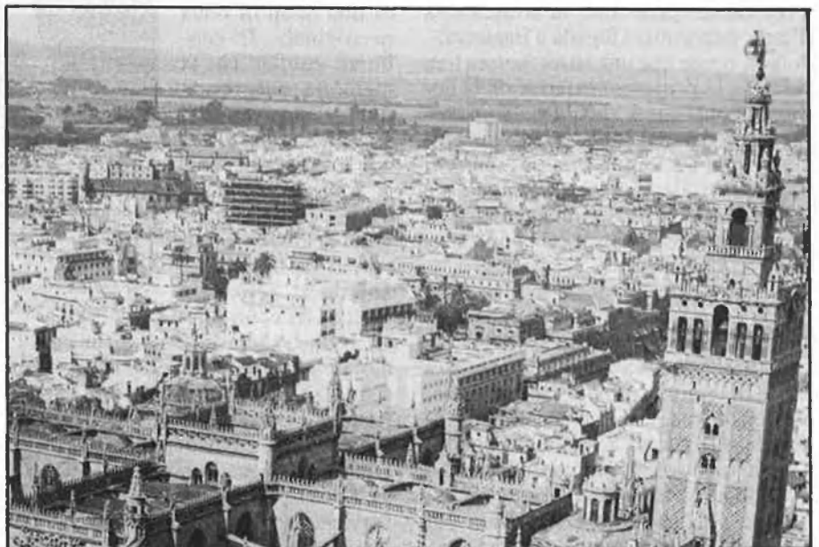
Andalusia és moda, costa poc i rendeix molt.

Amb la mediació de Saudesbank , la tardor de 1985 l'INI i la INC (National Industrialisation Company), organisme anàleg a Aràbia Saudita, van segellar un conveni de col·laboració i van posar la primera pedra per una societat mixta que permetera l'impuls d'in-