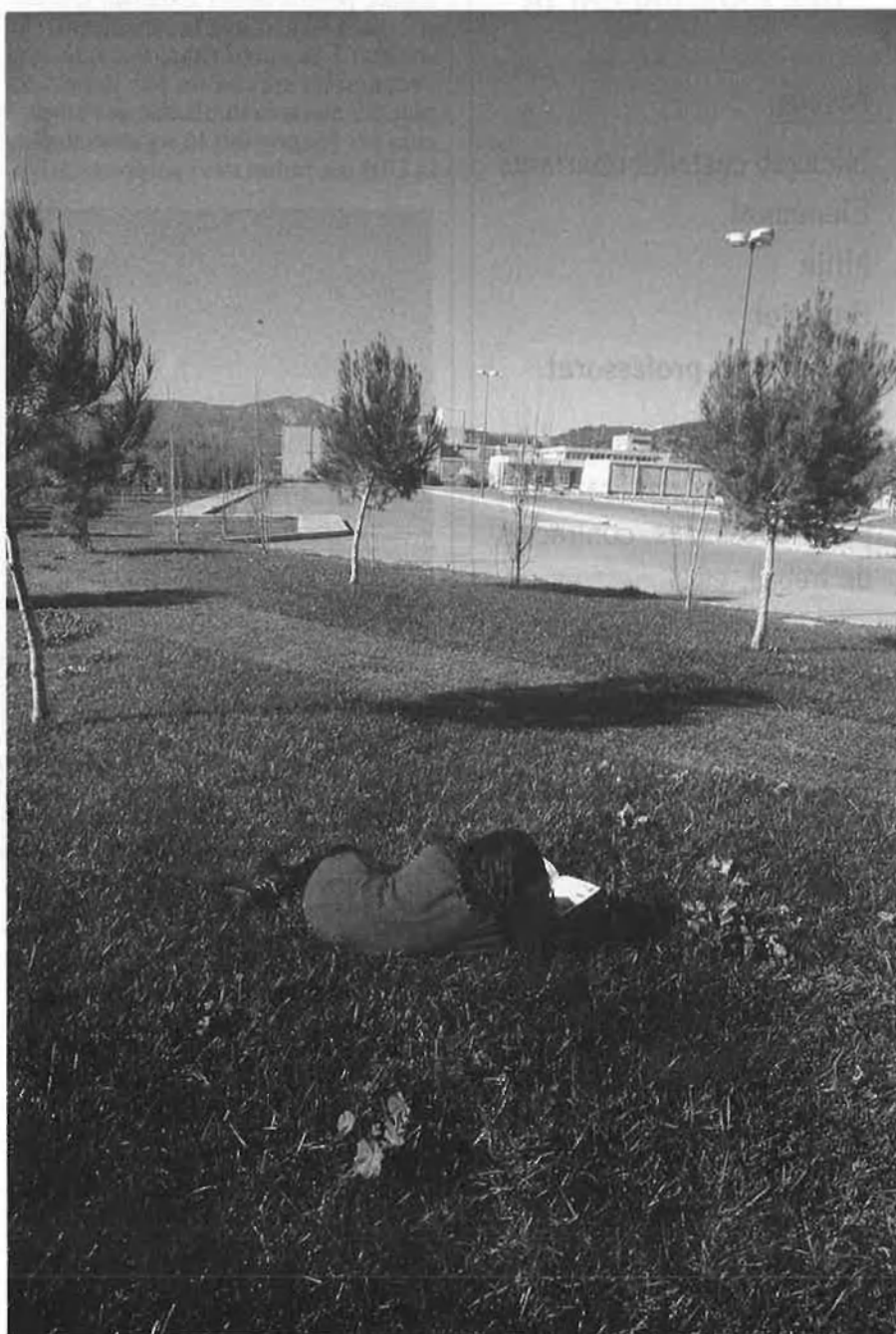
Vista del campus de la UIB.