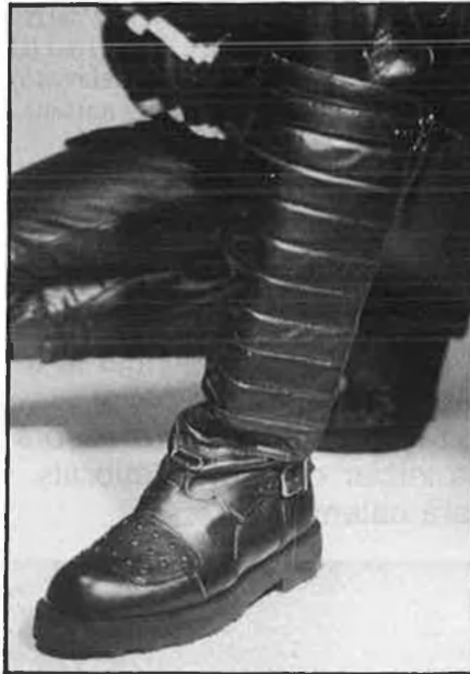
La Fira del Calçat, a punt de desaparèixer.