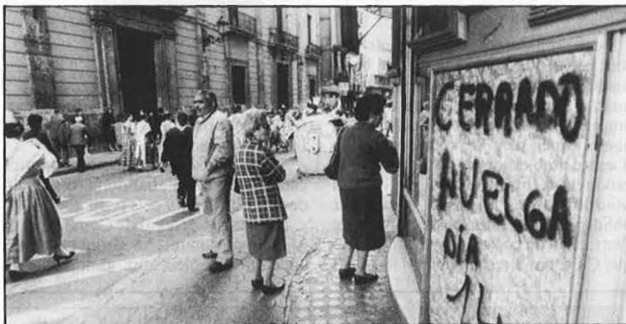
La vaga d'hoteleria, per Falles, marca l'inici d'una primavera que es presenta difícil.

D'aquesta manera empresaris, UGT i CCOO signaran en els pròxims dies el conveni, que ha costat de moment dos dies de vaga mentre s'arribava a un acord en la negociació. A tots aquests